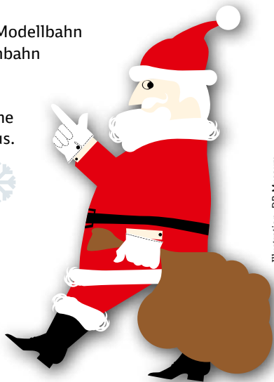
Illustration: DB Museum

Dauer: 10 bis 16 Uhr Kosten: Museumseintritt